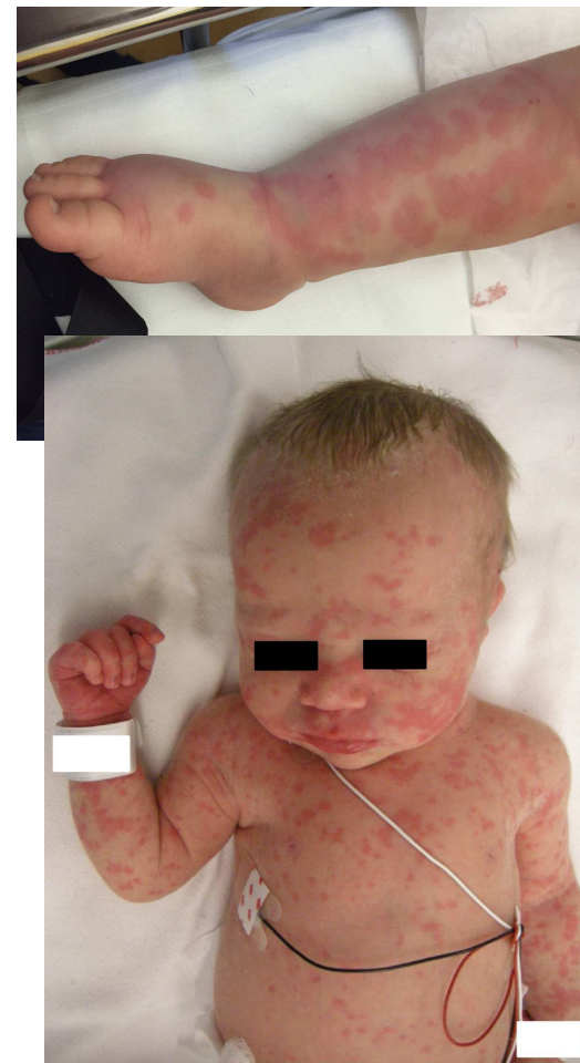
Sindromi Autoinfiammatorie Genetiche ad esordio anche neonatale