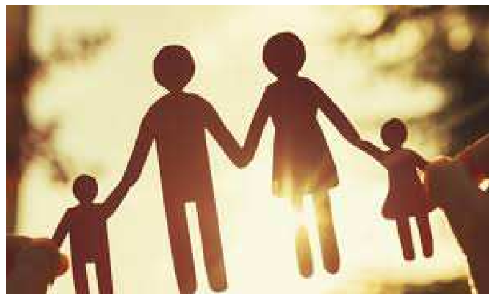
Festa delle Famiglie 2025 Condividere per crescere insieme!