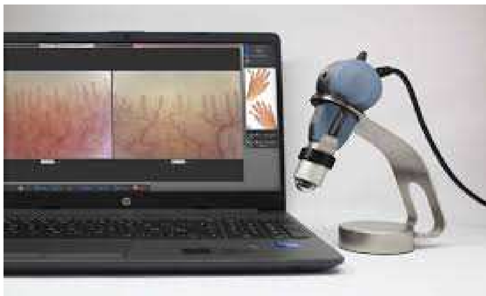
Un videocapillaroscopio per la diagnosi precoce delle sindromi sclerodermiche giovanili